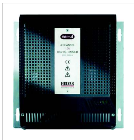
Tyristorový stmívač / 10A