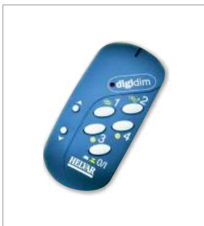
Dálkový IR vysílač